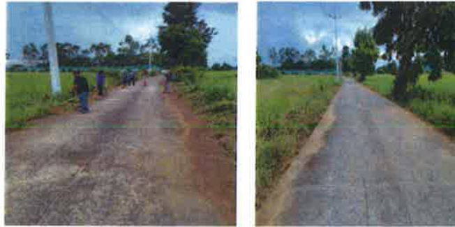
ภาพขณะดำเนินการ