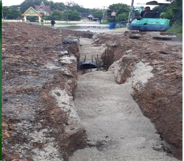
งานก่อสร้างถนน